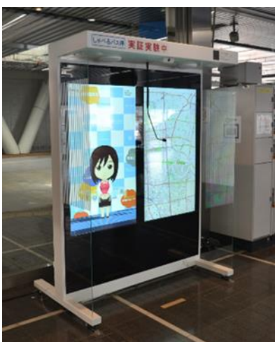
写真1 実証実験のため名古屋市栄バスターミナルに設置された「しゃべるバス停」(2018年3月)

さらに、このような地理情報システムは、バスのほか、色々な乗り物とうまく組み合わせ、将来的に増えていくと予想される自動運転への活用も見込まれる。